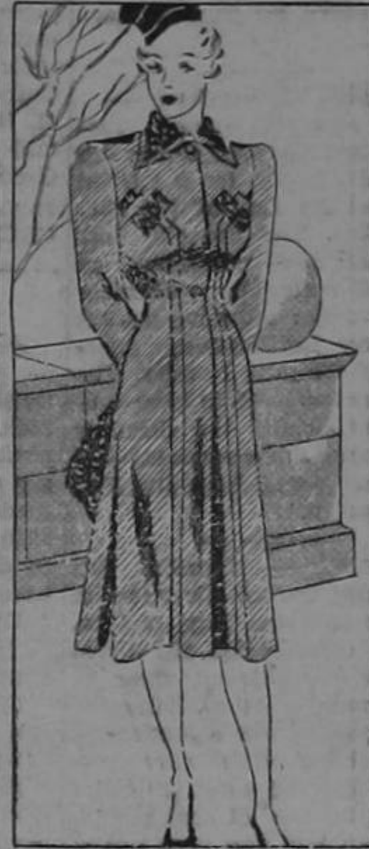
Woolen in deep golden yellow By VERA WINSTON

According to British Medical Experts canned blood, kept in cold storage, remains effective for two months after being "tapped" from a donor.